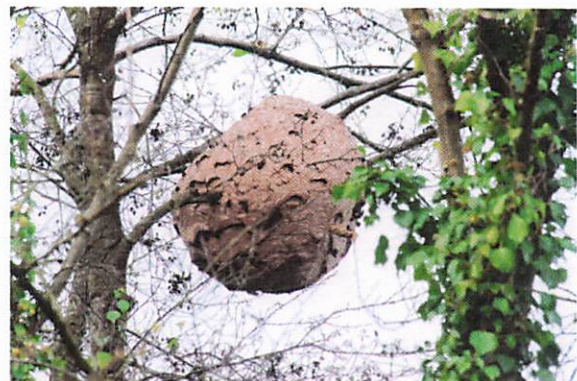
Nest der Asiatischen Hornisse

Als Imker bitten wir um Ihre Mithilfe: Die Asiatische Hornisse überfällt im Herbst oft Bienenvölker und räumt sie komplett aus: Alle Bienen, alle Brut. Das macht die Europäische Hornisse nicht! Bitte halten Sie in Ihren Baumkronen Ausschau nach dem Nest. Sollten Sie es entdecken, geben Sie bitte uns oder dem Vorstand Bescheid. Vielen Dank!